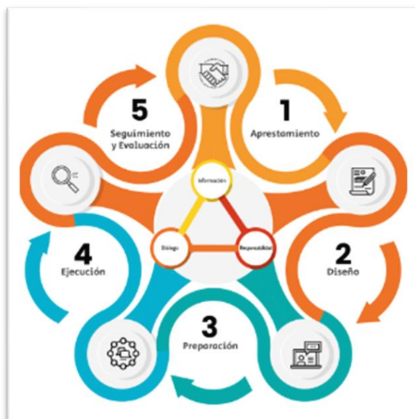
Ilustración o fotografía 1 – Etapas rendición pública Manual Único de Rendición de Cuentas - MURC