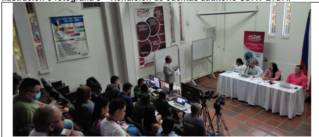
Ilustración o fotografía 3 – Rendición de cuentas auditorio CDAV LTDA.